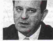
Η ΕΡΩΤΗΣΗ ΠΡΟΣ τον υπουργό Προστασίας του Πολίτη κ. Χρήστο Παπουτσή από τον βουλευτή της Α' Θεσσαλονίκης του ΛΑΟΣ κ. Αγγελό Κολοκοτρώνη

να καθίσουν κάπου, αλλά ούτε και να πάνε στην τουαλέτα. Αυτές οι τακτικές απαξι-