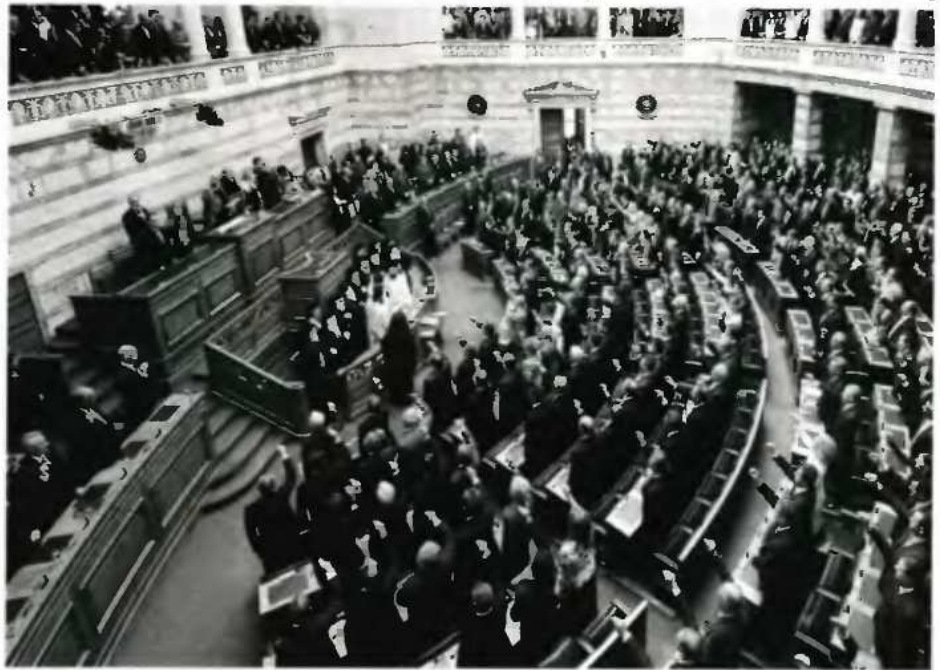
Τα στατιστικά στοιχεία είναι αδιάψευστος μάρτυρας της δράσης των βουλευτών.